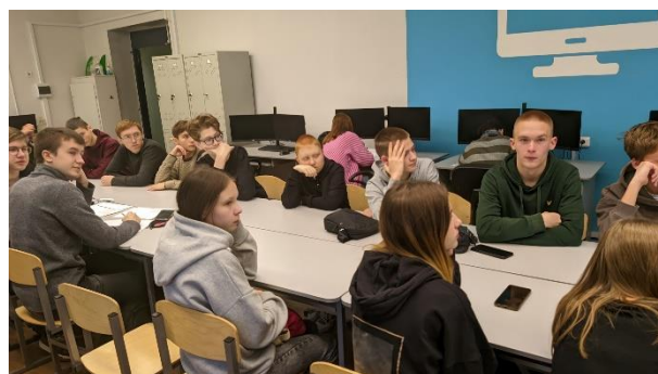
Студенты групп В-41, ЭЛС-21, А-11, А-21, И-11 на вебинаре «ФинТех тренды» 15 ноября 2023 г.