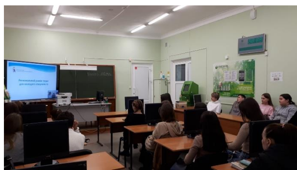
Студенты групп Км-31 и БД-31 на вебинаре «Региональный рынок труда для молодого специалиста. Траектория профессионального роста: тактика действий» 16 ноября 2023 г.