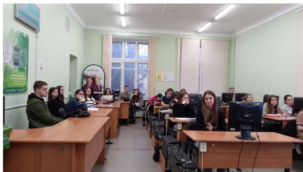
Студенты групп Л-21 и КМ-31 на вебинаре по Финансовой грамотности «Личный финансовый план: как превратить мечты в реальность» 14 ноября 2023 г.