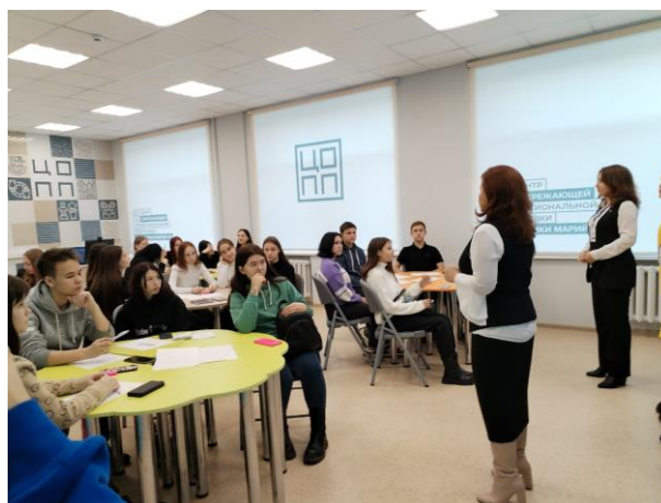
Студенты группы БД-21 на очной части форума по финансовой грамотности «ПРОФинансы» в Центре опережающей профессиональной подготовки Республики Марий Эл 17 ноября 2023 г.