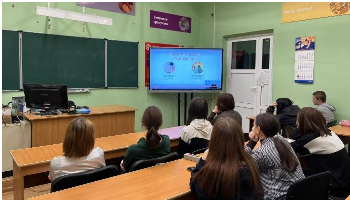
Студенты группы Км-21 на вебинаре «Нелегалы на финансовом рынке - кто они?» 15 ноября 2023 г.