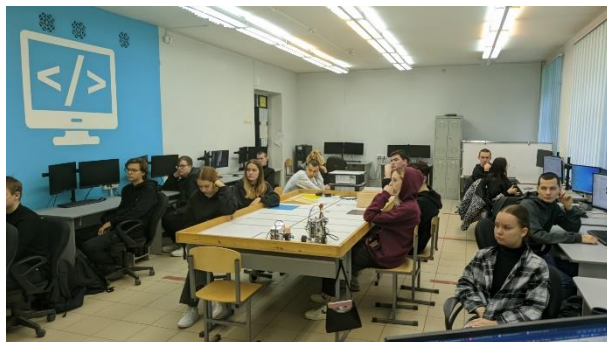
Студенты группы В-31 «IT-безопасность: как защитить свои финансы» 14 ноября 2023 г.