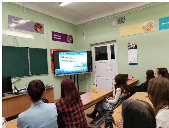
Студенты группы БД-21 на вебинаре «Личный финансовый план: как превратить мечты в реальность» 13 ноября 2023 г.