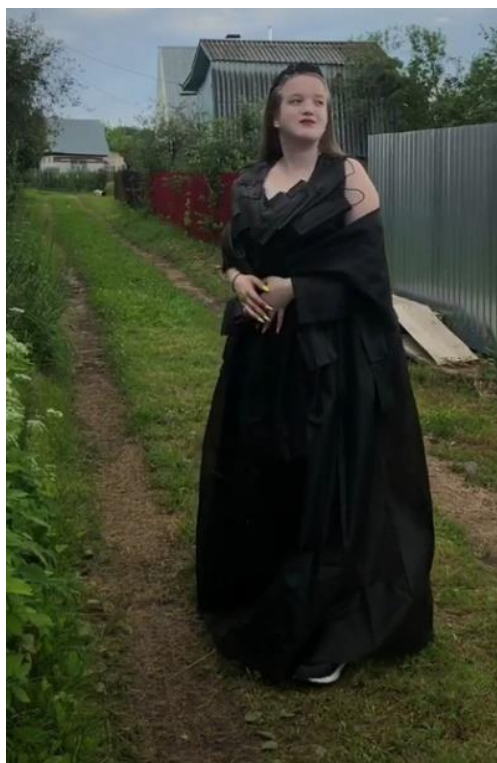
Образ «Черная корона»