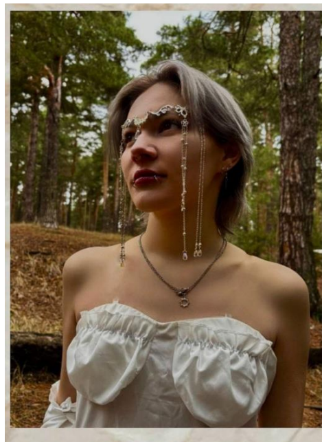
Образ «Лесные эльфы»

Автор: Альмашева Арина Маратовна, ГАПОУ «Колледж малого бизнеса и предпринимательства» г. Казань