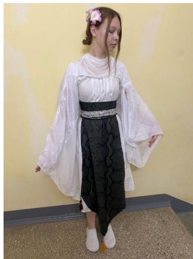
Образ «Источник творчества Китайский костюм» Автор: Бондаренко Арина Дмитриевна, ГБПОУ Республики Марий Эл «Йошкар-Олинский технологический колледж»