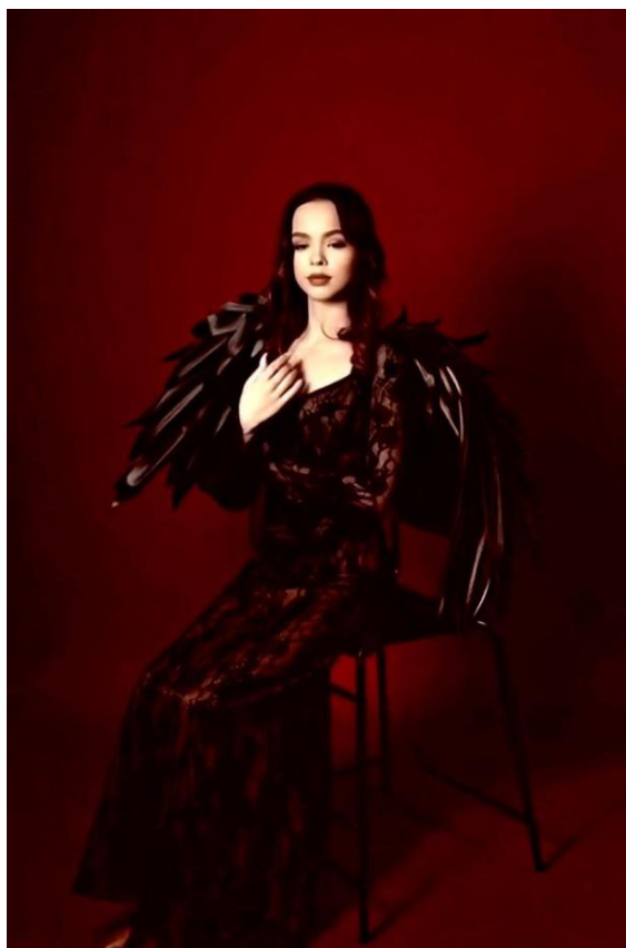
Образ «По творчеству Александра МакКуина». Автор: Лисенкова Алексия Олеговна, ГАПОУ «Колледж малого бизнеса и предпринимательства» г. Казань