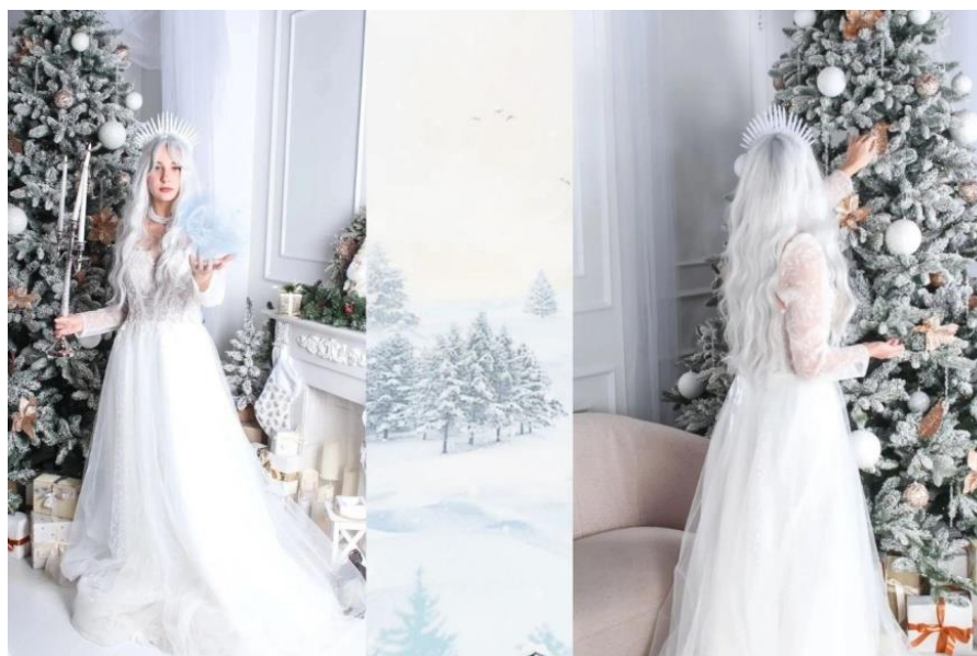
Образ «Снежная королева».

Автор: Григорьева Параскева Анатольевна, ГАПОУ «Колледж малого бизнеса и предпринимательства» г. Казань