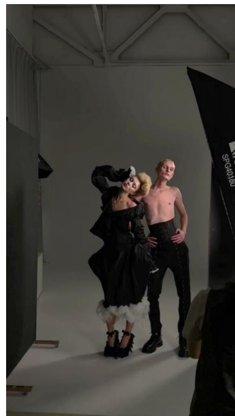
Образ «По творчеству Джона Гальяно для модного дома Маржела». Автор: Крюков Никита Сергеевич, ГАПОУ «Колледж малого бизнеса и предпринимательства» г. Казань