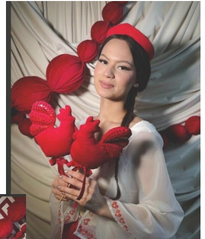
Образ «Славянско-чувашская палитра» Автор: Тимофеева Наталья Дмитриевна, ГАПУ «Чебоксарский техникум технологии, питания и коммерции»