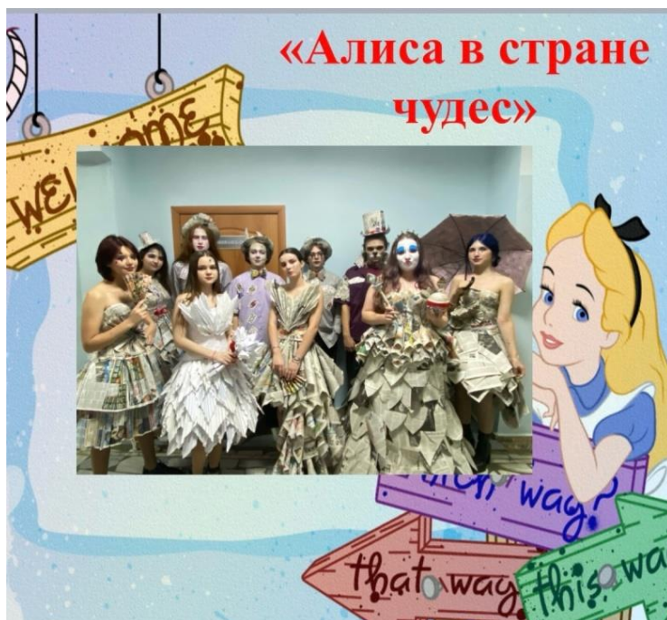
Образ «Алиса в стране чудес»

Автор: Скрипичникова Ярослава Сергеевна, ГАПУ «Чебоксарский техникум технологии, питания и коммерции»