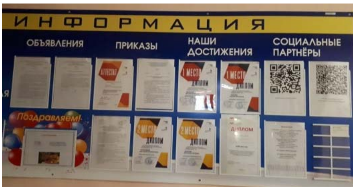
Фото 5. Информационный стенд

Для обеспечения эффективности работы Центра на сайте колледжа размещена ссылка ( http://edu.mari.ru/prof/ou5/ ) на Центр. Созданы условия для информационного обеспечения выпускников о вакансиях и актуальным вопросам трудоустройства. На информационном стенде колледжа в рубрике «Социальные партнеры» для студентов доводится актуальная информация о вакансиях на текущий период.